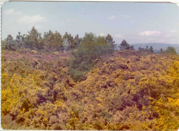
1.579.- Vegetación del sotobosque formada por brechina común, brezo y otras ericáceas, así como por distintos tipos de Tojos. ( Ulex europaeus y Ulex nanus ).