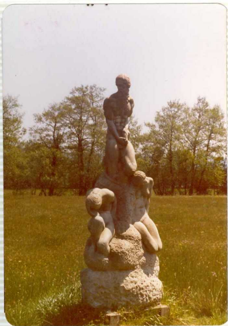
1.577.- Conjunto escultórico denominado "Breogan" (personaje mitológico gallego). Nacimiento popular del río Miño. (Fonmiñana).