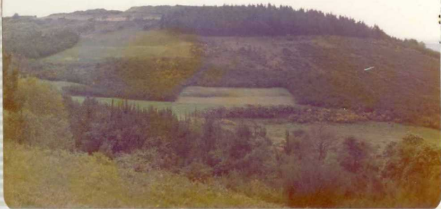
1.576.- Castro de Belmonte que está siendo restaurado por la Dirección General de Bellas Artes. Hoja de Cas troverde, próximo al límite con la Ho ja de Meira.