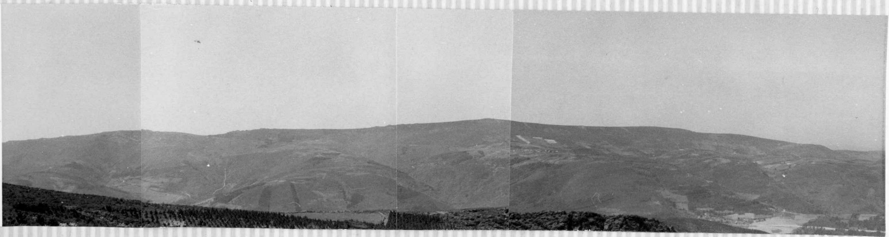
672.- Vista de la Sierra de Meira desde el Este.