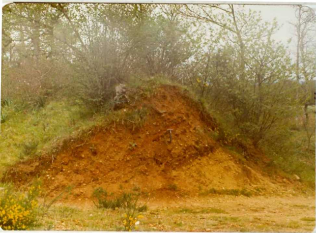
1.555.- Corte de la muralla interna del Castro de Beján.