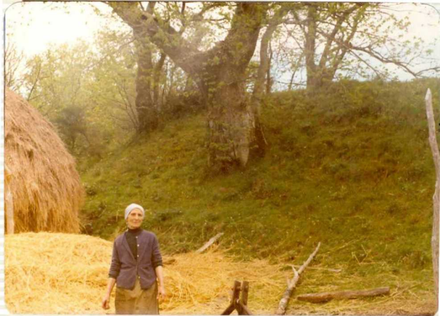
1.554.- Muralla interna del Castro de Beján.