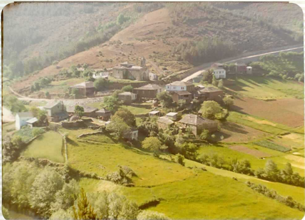
1.575.- Vista general de la Parroquia de Piquín. Valle del río Eo.